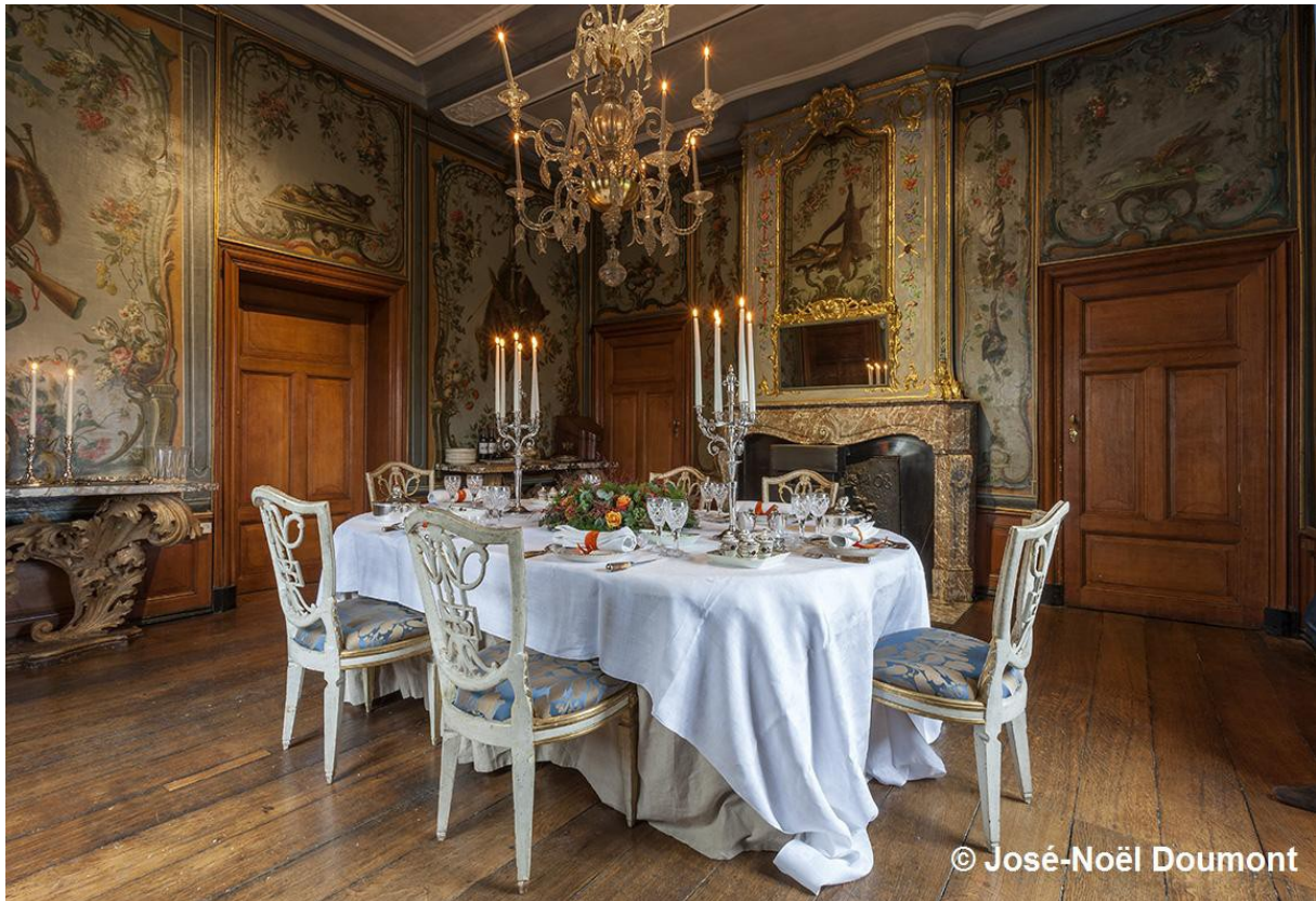
La salle à manger de chasse